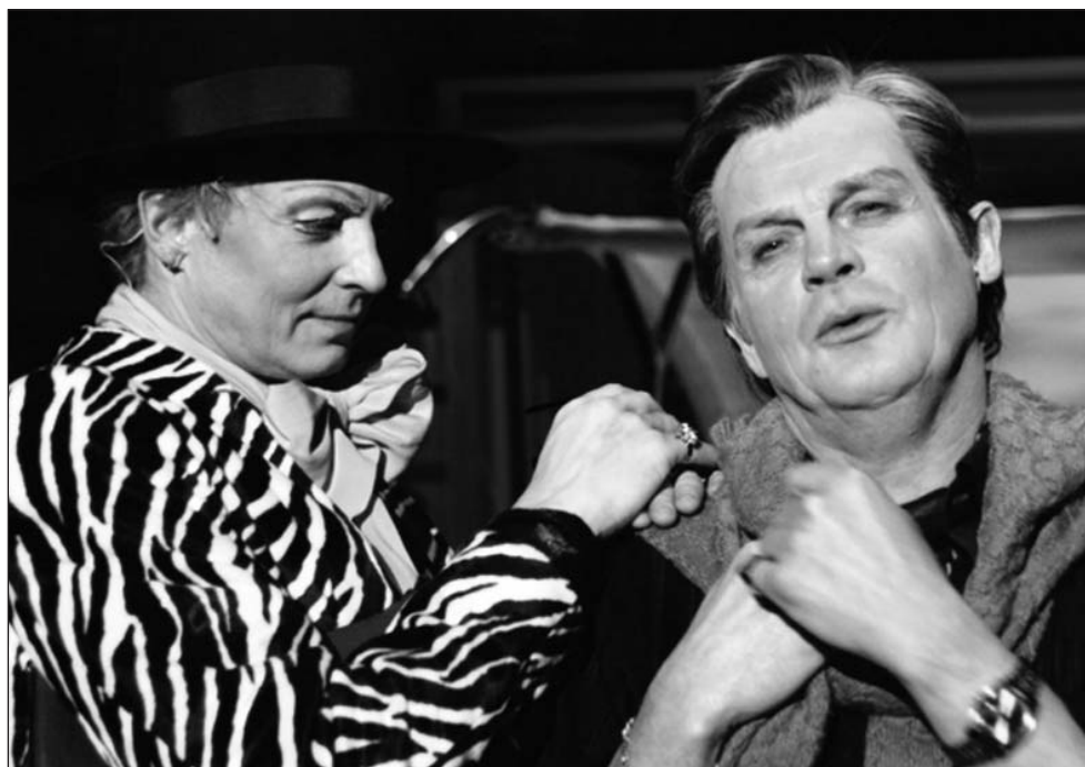
La Cage aux Folles