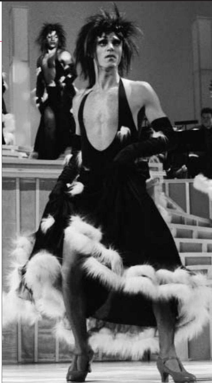
La Cage aux Folles

Premiere Oslo Nye Hovedscenen 29. januar