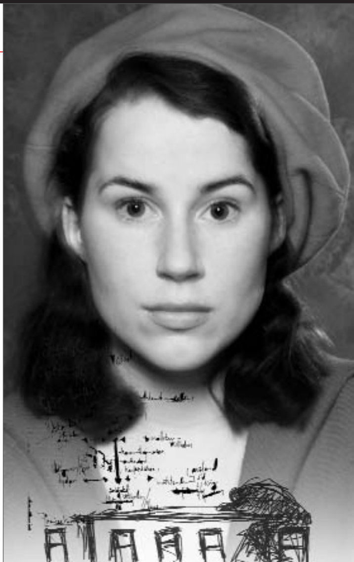
Appelsinene på Fagerborg

Urpremiere Oslo Nye Centralteatret 3. september