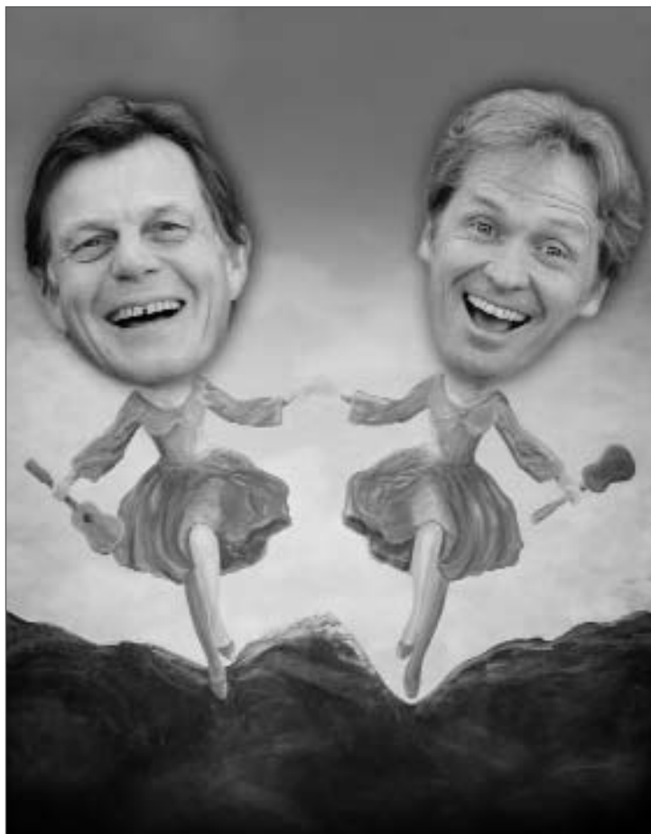
Sound of Musvik