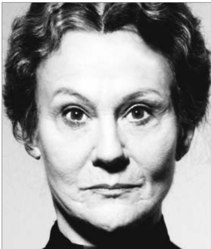
Bernarda Albas hus

Premiere Oslo Nye Centralteatret 5. mars