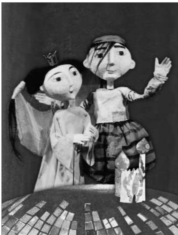
Aladdin og den magiske lampen

Spilt i Oslo Nye Trikkehallen og som oppsøkende forestilling (Urpremiere 18. august 2000)