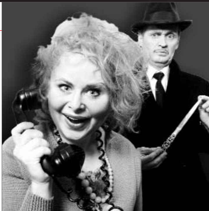
Skulle det dukke opp flere lik, er det bare å ringe...

Premiere Oslo Nye Centralteatret 16. januar