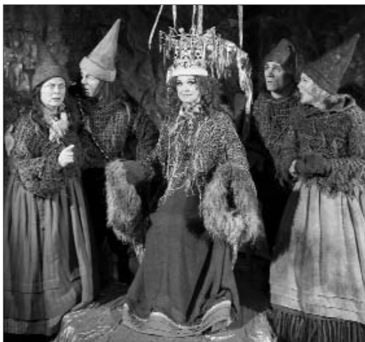
Jul i Blåfjell