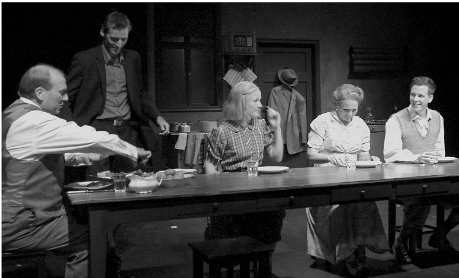
Appelsinene på Fagerborg