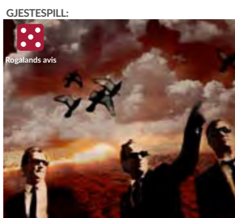
GJESTESPILL: 1066 - SLAGET VED STAMFORD BRIDGE Spilles 18. nov.-11. des. 2020 Centralteatret