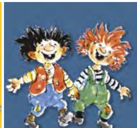
KARIUS OG BAKTUS Spilles til 10. oktober 2020 Trikkestallen