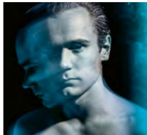
20. NOVEMBER Norgespremiere 20. november 2020 Teaterkjeller'n