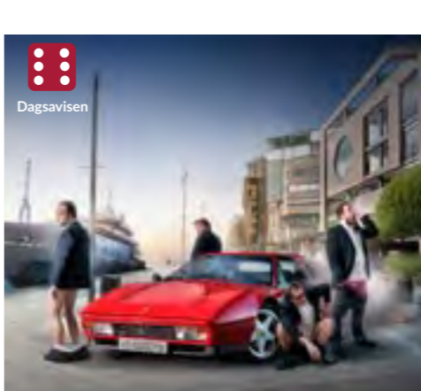
1980 - AKER BRYGGE Spilles 21. nov.-17. des. 2020 Centralteatret