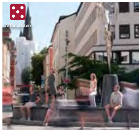
MENS VI VENTER FÅR VI GÅ audioguidet vandreteater - når du vil Starte utenfor Hovedscenen