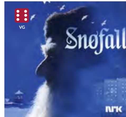
SNØFALL Sesongpremiere 13. nov. 2020 Hovedscenen